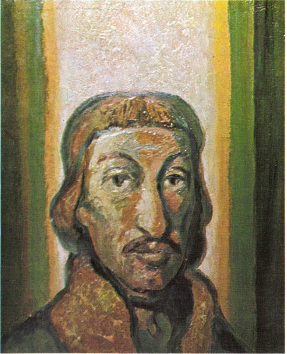
Menyhárt József: Csokonai