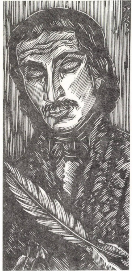
Gy. Szabó Béla: Csokonai (fametszet)