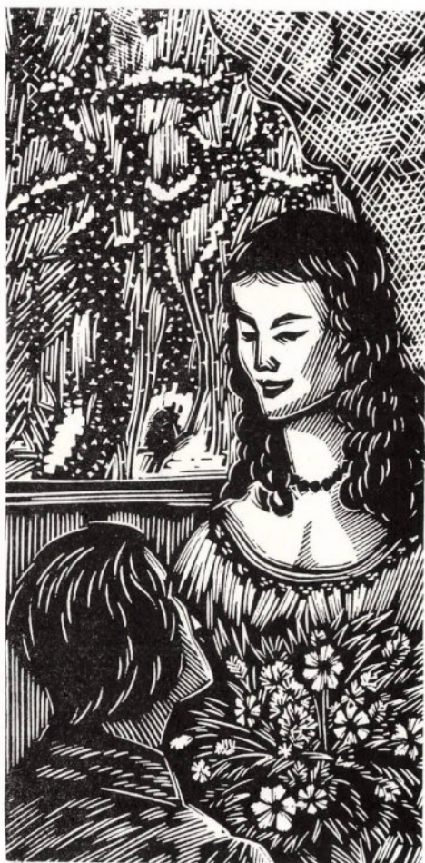
Gy. Szabó Béla: Illusztráció Csokonai Köszöntő c. verséhez (fametszet)