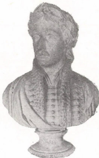
Ferenczy István: Csokonai

Az Anakreoni dalok Márton-féle kiadásának címlapja