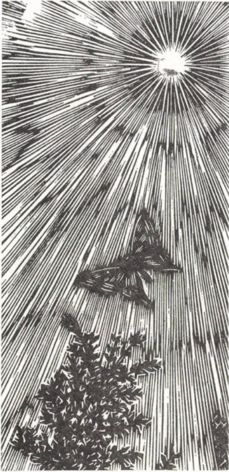
Gy. Szabó Béla: Illusztráció Csokonai A pillangó c. verséhez (fametszet)