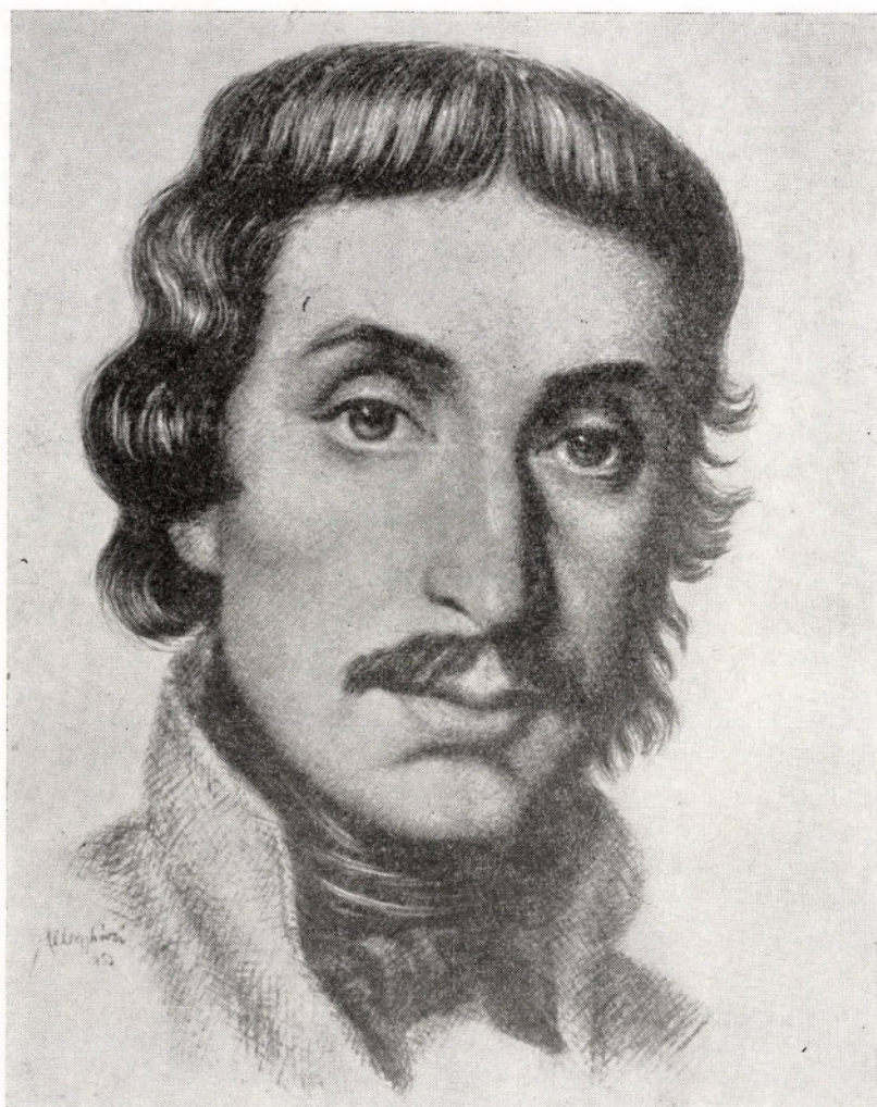
Félegyházi László rajza