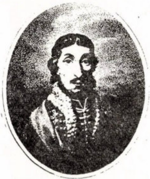
Csokonai Vitéz - Mihály

Született Debreczenben 1773. Meghalt 1805.