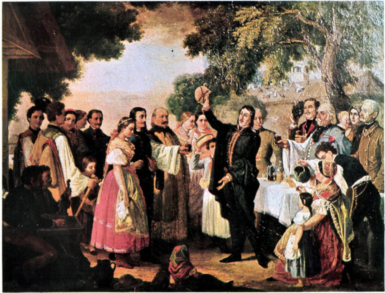
Jankó János: Csokonai a lakodalomban